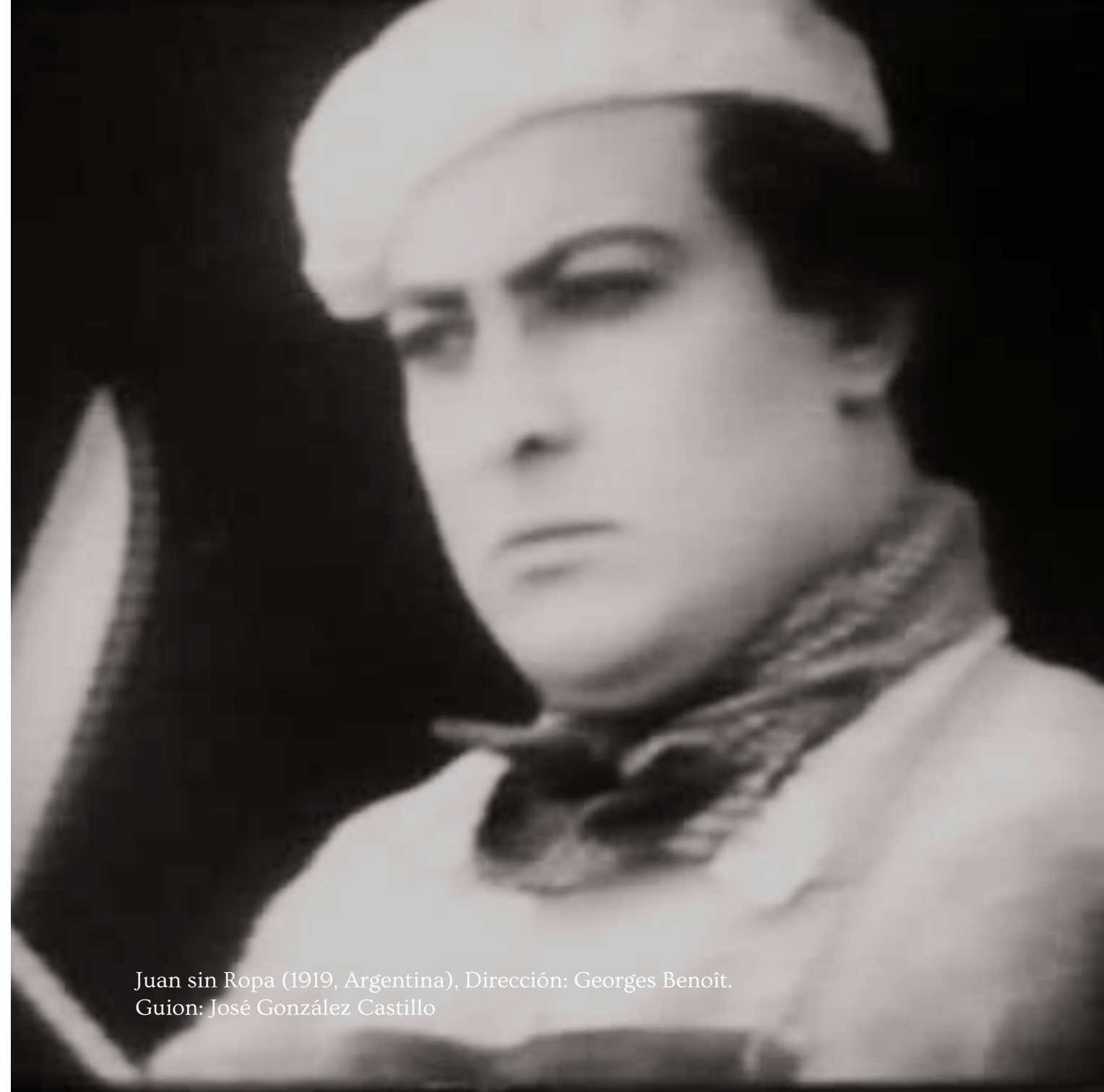
Juan sin Ropa (1919, Argentina), Dirección: Georges Benoît. Guion: José González Castillo

La Constitución, el Estado y el Cine durante la «guerra civil internacional» en Argentina, 1914-1955