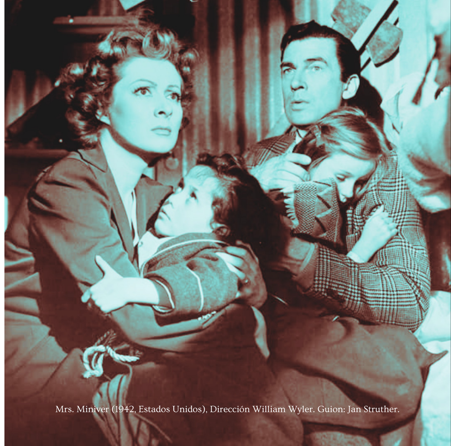
Mrs. Miniver (1942, Estados Unidos), Dirección William Wyler. Guion: Jan Struther.

La Iglesia en la platea de películas malas: Calificación moral del cine por parte de la Acción Católica de la Provincia de San Juan en el año 1950