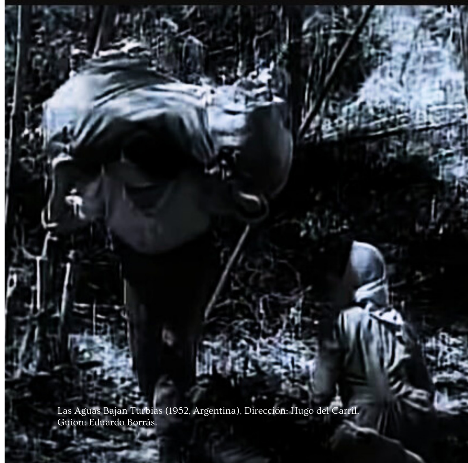
Las Aguas Bajan Turbias (1952, Argentina), Dirección: Hugo del Carril. Guion: Eduardo Borrás.

Sobre el poder del texto cinematográfico como narrativización de la hegemonía peronista en Las Aguas Bajan Turbias de Hugo del Carril (1952)