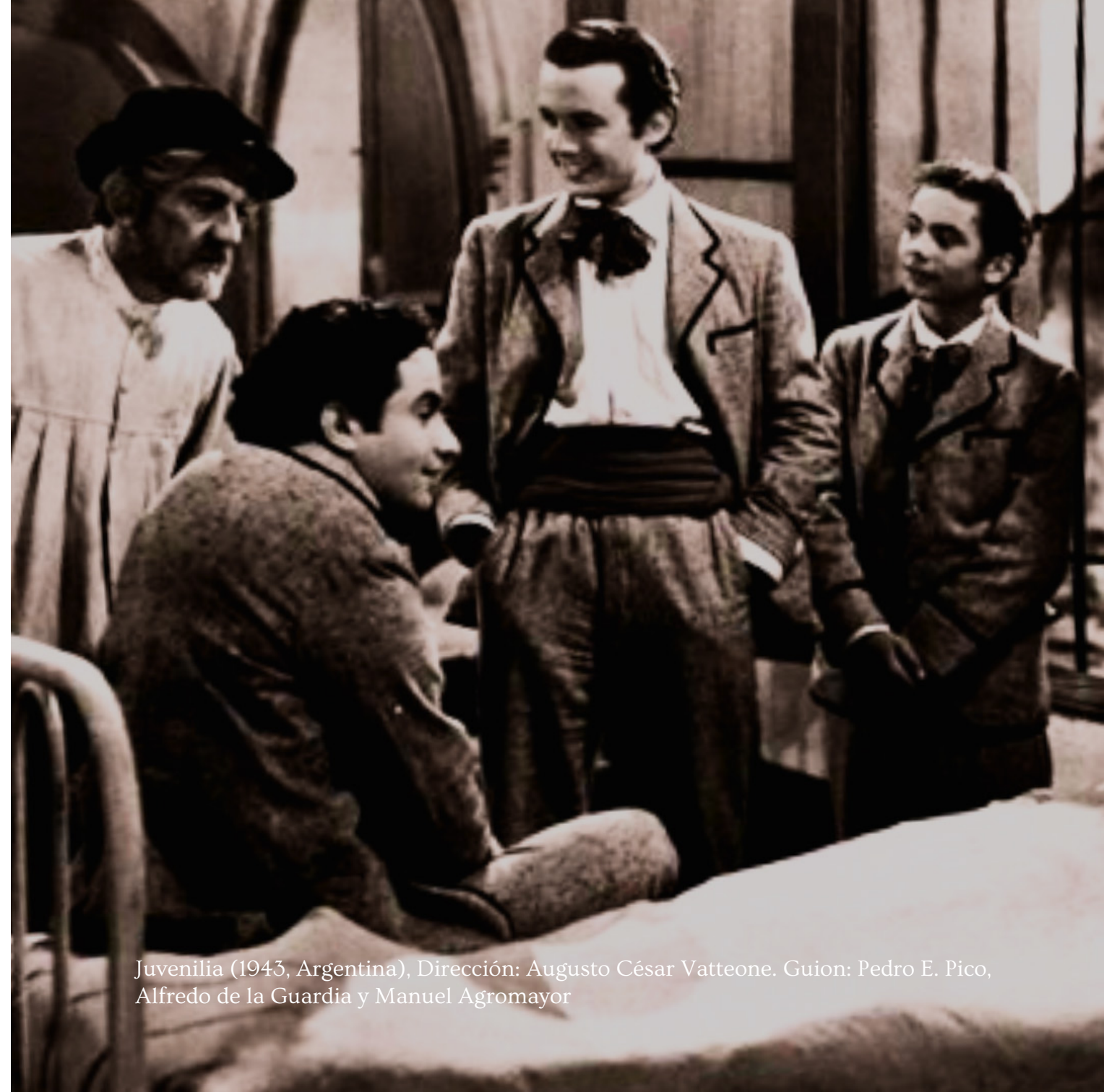
Juvenilia (1943, Argentina), Dirección: Augusto César Vatteone. Guion: Pedro E. Pico, Alfredo de la Guardia y Manuel Agromayor

Estrategias de racialización en el cine argentino de principios de siglo XX