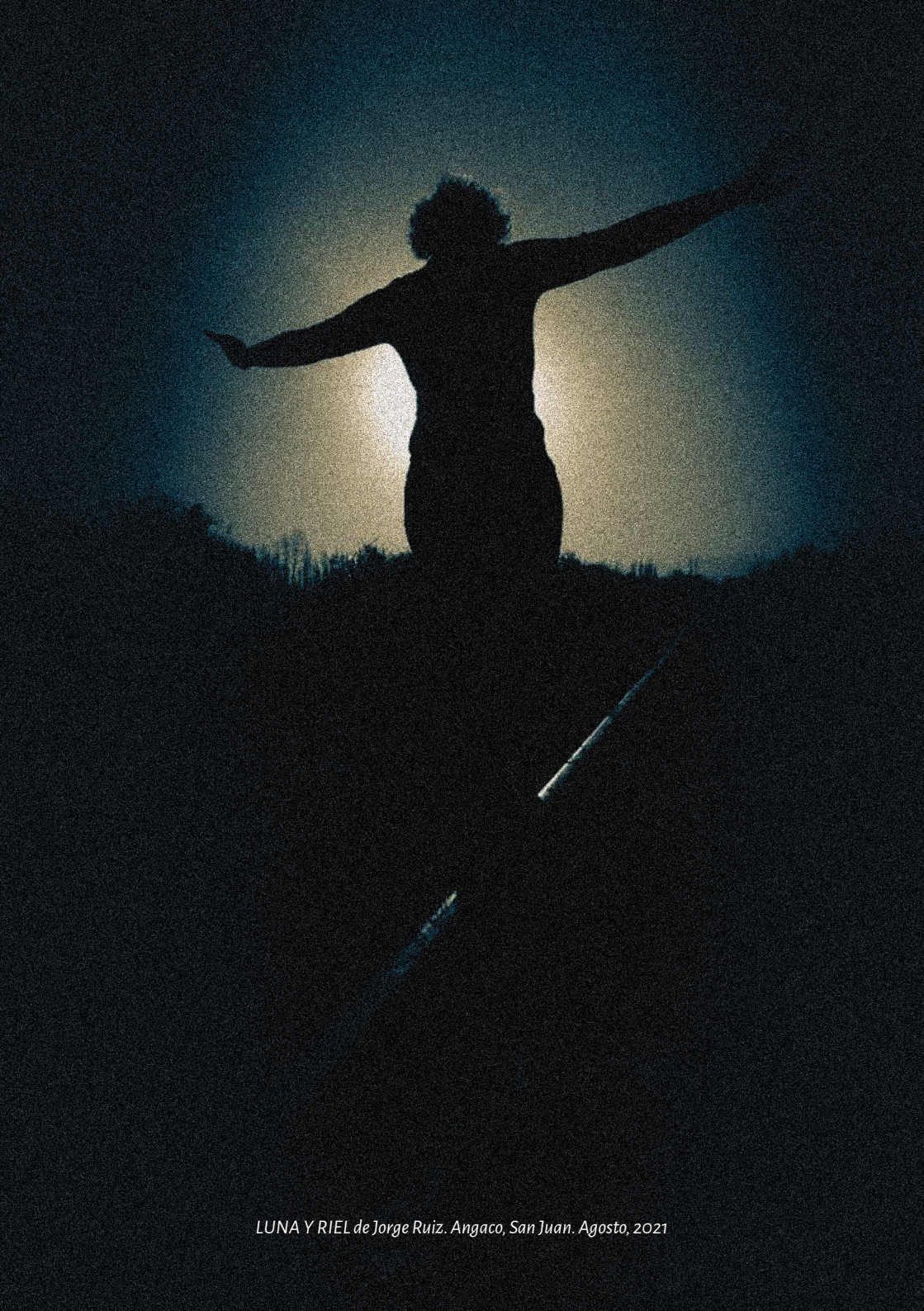
LUNA Y RIEL de Jorge Ruiz. Angaco, San Juan. Agosto, 2021